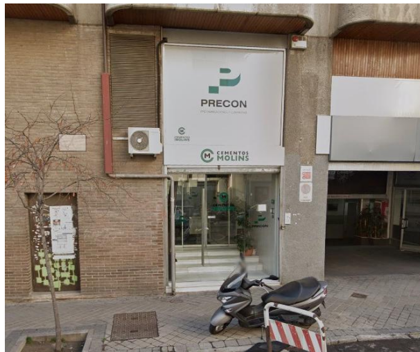
Oficinas en alquiler