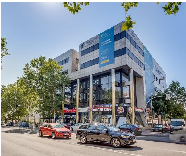
Oficinas en venta y alquiler