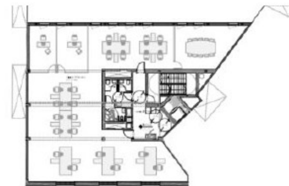
PLANO PLANTA TIPO