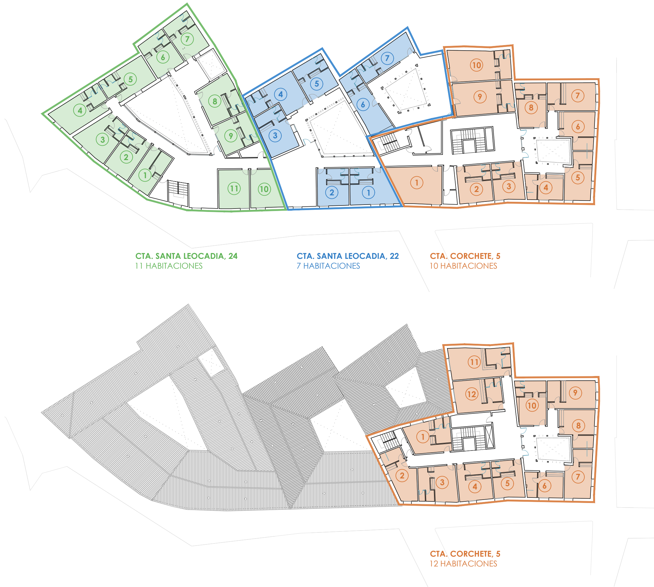
CTA. SANTA LEOCADIA, 24 11 HABITACIONES