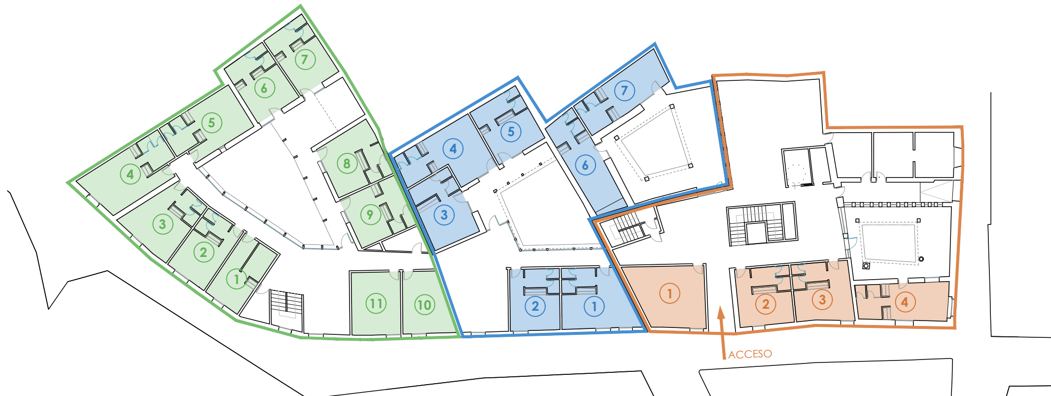
PLANTA BAJA 1/300